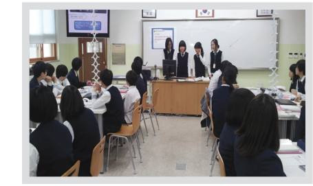
과학 수업 (팀별 프로젝트 발표)