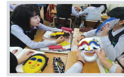
국어과, 미술과, 사회과, 코티칭 융합수업 (하회탈만들기)